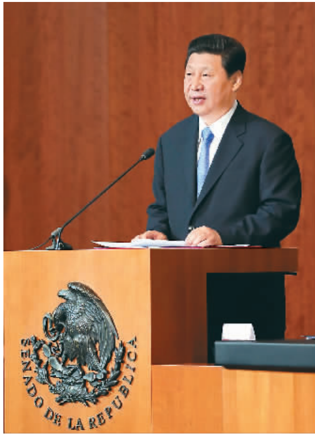
图为习近平在墨西哥参议院发表演讲。