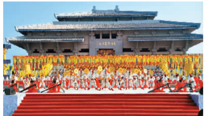
6月4日,癸巳年世界华人炎帝故里寻根节在湖北随州举行。来自40多个国家和地区的华侨华人代表、海内外万余名嘉宾出席。图为演员在开幕式现场表演。