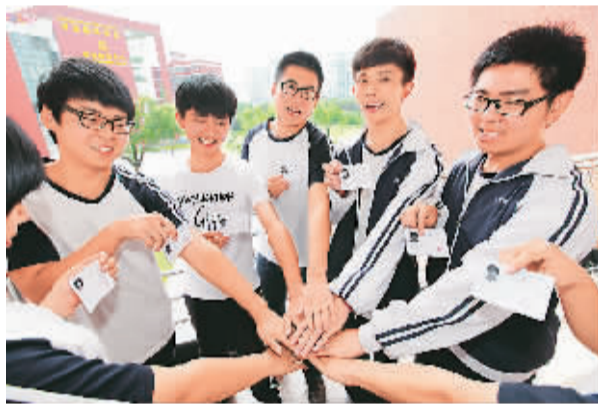
今年是浙江省出台“异地高考”政策的第一年,共有984名外省籍进城务工人员随迁子女成为“同省同待遇”的首批受益者。图为外地“随迁子女”拿到了高考准考证。