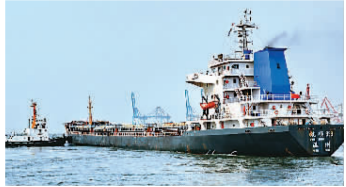
6月4日,随着帆船999号轮船载着秦皇岛西港区最后的2.1万吨煤缓缓驶离三公司老煤炭码头9号泊位,有着115年历史的秦皇岛三公司老煤炭码头正式关闭。这标志着秦皇岛西港搬迁改造工程正式启动。工程将4.5公里长的海岸线还于市民,腾出6700亩土地实施综合开发改造。

图为一般拖轮协助帆船999号轮船驶离秦皇岛三公司老煤炭码头9号泊位。