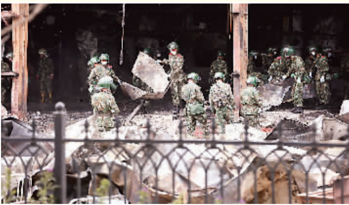
武警官兵在清理火灾事故现场。新华社记者 金立旺摄

车间已经只剩下钢架结构,工作人员正在清理现场。记者没有看到现场有干粉灭火器、应急灯