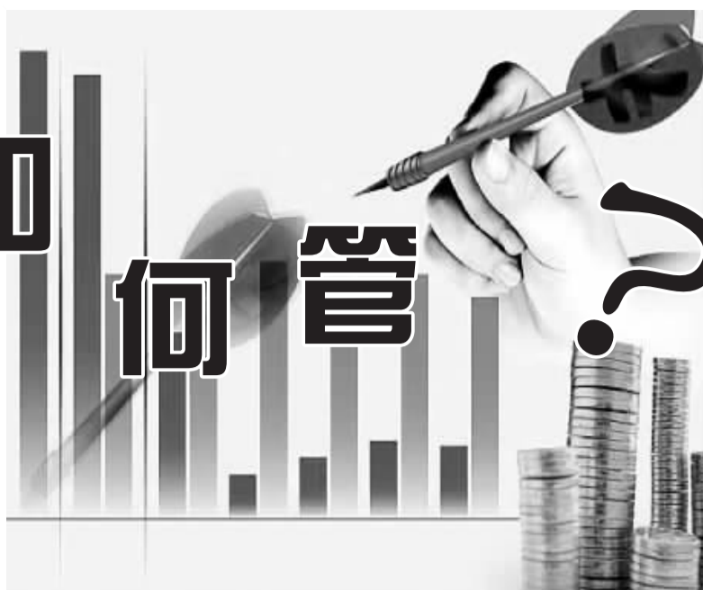
香港“公务酬酢”开支需目的明确，保证“用得其所”。

不过，自1997年7月起，行政长官每月领取非实报实销酬酢津贴，用以支付在官邸举行的公务酬酢开支。这项津贴的标准，目前为每月66650元。这部分无需以发票报销，也不计算在“酬酢开支”之内。