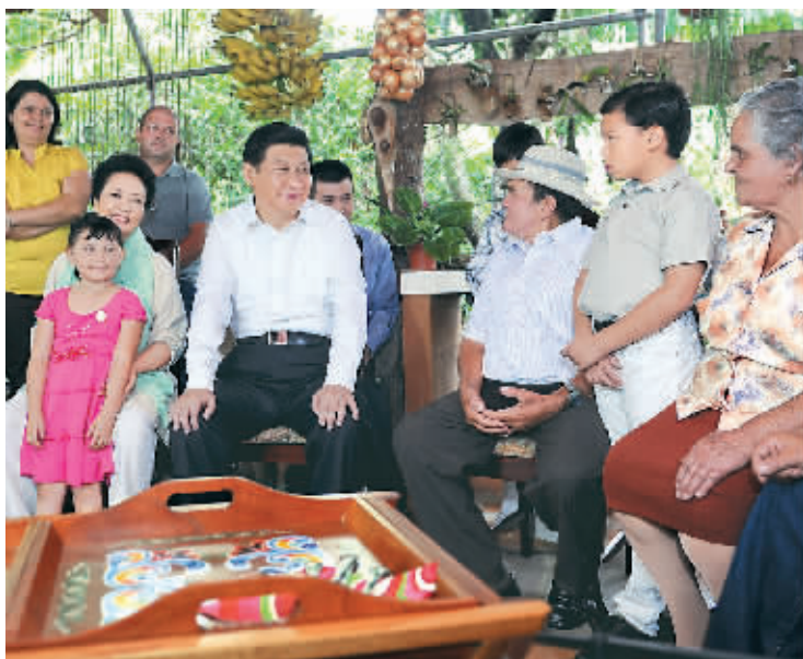
六月三日,正在哥斯达黎加进行国事访问的国家主席习近平和夫人彭丽媛与当地农户萨莫拉一家交流。

哥两国同属发展中国家,处于相似的发展阶段,面临发展经济、改善民生的共同任务。刚才,两国政府部门和企业签署了一系列合作协议。中方愿同哥方一道努力,谱写两国友好关系新篇章。