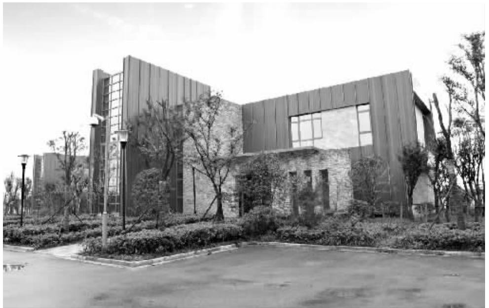
江苏省南京市江宁区青龙山总部经济岛内一瞥。