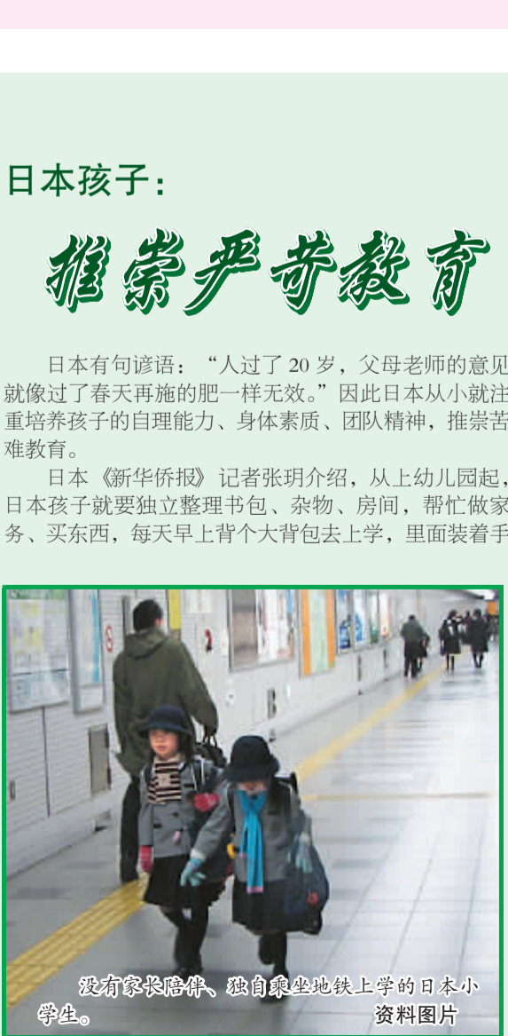
没有家长陪伴、独自乘坐地铁上学的日本小学生。

新西兰的公立中小学都是免费的，不过，每所学校从教育部获得的经费不一样，学生家庭收入越高的学校