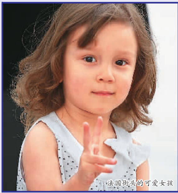
法国街头的可爱女孩

法国《欧洲时报》中文学校负责人在接受本报采访时表示，在法国，儿童自2岁半开始进幼儿园，初步学会书写，通过艺术创作培养想象力和创造力。幼儿园入