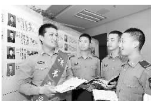
南京军区联勤某分部在机关和基层一线广泛开展“读经典学哲学”活动，用读书学习提升能力素质，提升服务保障质量，提升创新发展水平。