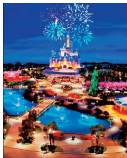
▲ 奇幻童话城堡效果图(局部)。

5月24日,施工团队将城堡的第一根永久混凝土桩打入地基,这标志着上海迪士尼乐园奇幻童话城堡的施工正式启动,奇幻童话城堡将是上海迪士尼乐园内的标志性中心景点。