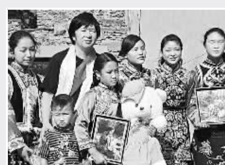
美籍孩子与画家在一起

李自健多年坚持慈善义举，捐建希望小学、修建乡村公路、资助失学儿童、专设奖学金支持贫困大学生。近10年来，他每年都要资助100名正在求学的中国大学生。最近他又捐赠600万元人民币，在母校广州美院设立“人性与爱·李自健艺术奖助学金”永久基金。他说：“这些是我毕生奋斗打造的‘人性与爱’这件大作品不可分割的一部分。”