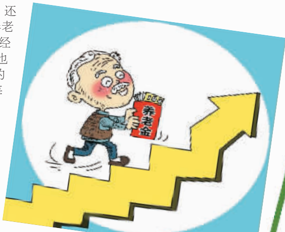
步步高 朱慧卿作

对于老龄化更加严重的未来，我们也不必过于紧张。在唐钧教授看来，即使在老龄化最高峰的2050年左右，中国仍有8亿多的劳动力，他们的财富创造能力足以支撑国家的养老体系和经济发展。“对于养老金的信心其实就是对国家发展的信心，我们应当有这样的信心。”