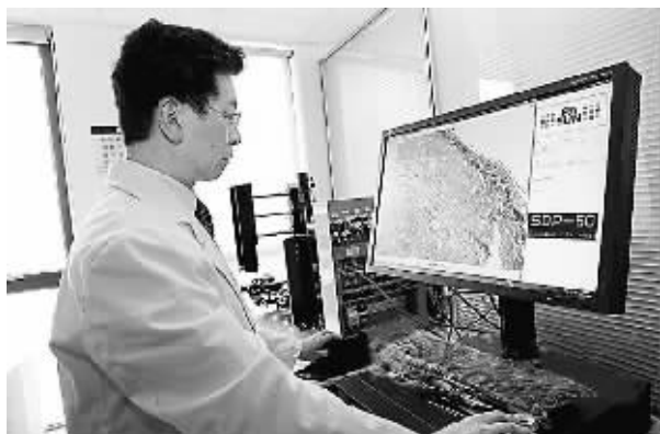
专家对出口设备进行最后检测

今天的云南山瀑拥有80余种自主知识产权远程医疗设备、远程医疗附属设备、远程教育设备及PACS系统及HIS、RIS、LIS、PACS、EMR、EHR等近百种医疗信息化软件产品；可提供远程医疗、医院信息化、区域医疗信息化整体解决方案；拥有覆盖国内近千家医疗机构、南非400多家医疗机构的远程医疗网；建立了国内最大的远程医疗服务平台，是承担“国家高技术产业化重大专项”和“国家火炬计划项目”、经正式认证的“国家级软件骨干企业”，也是世界规模最大的远程医疗设备及其附属设备、数字化医疗设备、医疗信息化软件的生产开发商之一；是被吸纳加入国际最权威机构“美国远程医疗协会(ATA)”的第一家及唯一一家中国会员，也是被邀请参与与美国贸易发展署(TDA)“亚洲健康产业计划”的第一家和唯一一家中国企业。