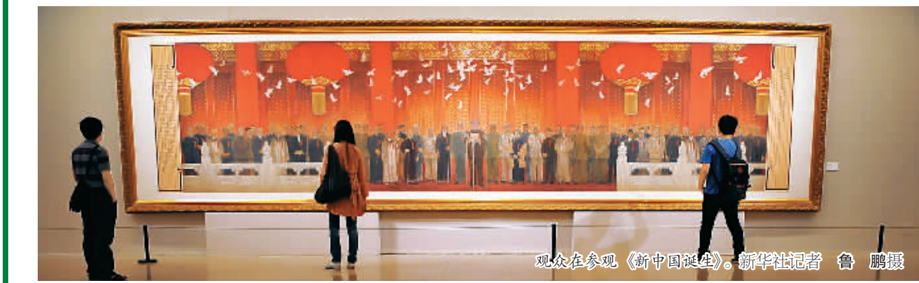
观众在参观《新中国诞生》。

本报北京5月20日电 (记者徐红梅) “与时代同行——中国美术馆建馆50周年藏品大展”, 今天下午正式开幕。诸多镇馆之宝与历史档案同时与观众见面, 将中国美术馆建馆50周年系列活动推向高潮。 此次展览全部依托该馆馆藏, 展出的666件作品从4万余件藏品中遴选而出, 涵盖中国画、油画、版画、雕塑、连环画、年画、漫画、宣传画、水彩画、装置、综合绘画等门类, 包括一些以前没有展出过的经典巨制和最新入藏的作品, 以传承与引进、苦难与抗