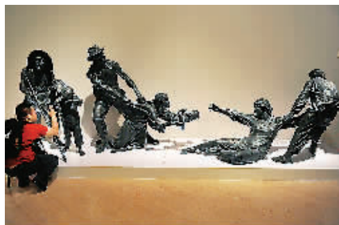
观众在拍摄雕塑《收租院》