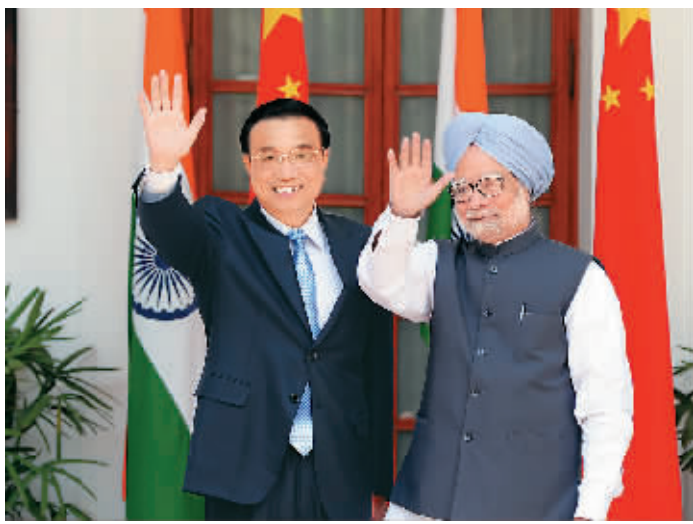
5月20日, 国务院总理李克强在新德里与印度总理辛格举行会谈。