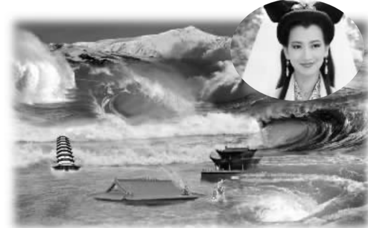
水漫金山图及电视剧《新白娘子传奇》剧照

只是镇江内其它寺庙里的一个行为怪异的挂单和尚。那么，为什么传说会把法海安排在金山寺呢？我想大概有两个原因吧。一是《金山志》、《京口三山志》等史料中记载：金山寺曾有一老僧将古洞中蟒蛇赶走，清理古洞进行修禅。这个故事版本很多，后来经过历朝历代的演绎流传，最后演变成了白娘子、许仙、法海的故事。