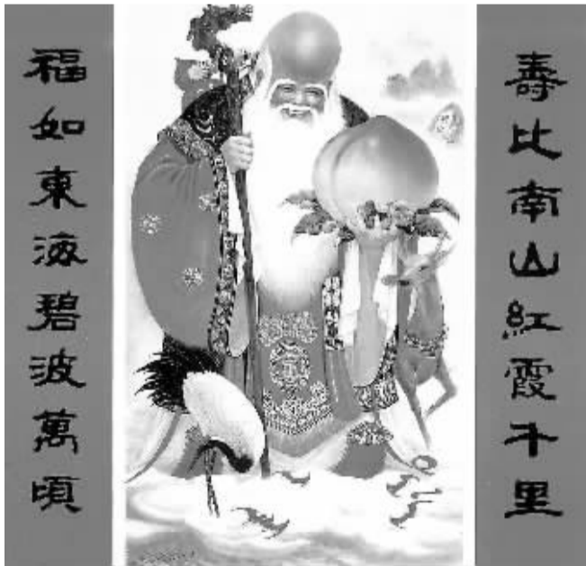
寿星老年画

长冲村人为何能长寿？据说这与当地的自然条件有关系。该村全境土壤中硒含量在0.4mg/kg以上，均为富硒土，地上种植的农产品，多数已达到富硒食品的标准。这富硒土有抗氧化、抗癌、