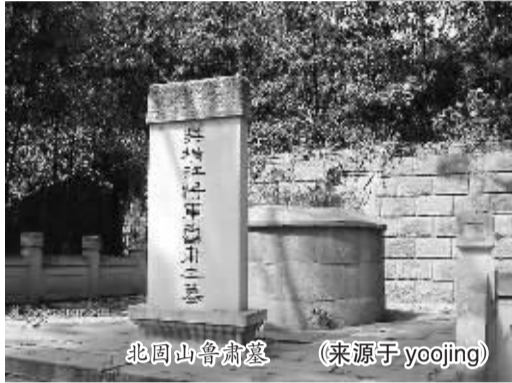
北固山鲁肃墓