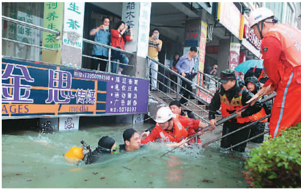
5月16日凌晨,厦门突降60年来最大暴雨。图为在思明区前埔明发新城,东海救助局厦门救基地潜水员成功将被困水下8个多小时的男子救出。

本报北京5月16日电(记者潘跃)5月14日以来,南方遭遇强降雨袭击,局地伴有雷电、大风、冰雹等强对流天气,引发洪涝、风雹、山体滑坡等灾害。据民政部、国家减灾办统计,截至今天20时,灾害已造成安徽、福建、江西、湖北、湖南、广东、广西、重庆、四川、贵州10省区市因灾死亡34人,失踪12人,其中,广东因灾死亡19人、失踪11人;福建、江西、湖南、四川各因灾死亡3人;湖北、广西、贵州各因灾死亡1人。 针对广东暴雨洪涝灾情,国家减灾委、民政部紧急启动国家四级救灾应急响应,并于今天派出工作组赶赴灾区。