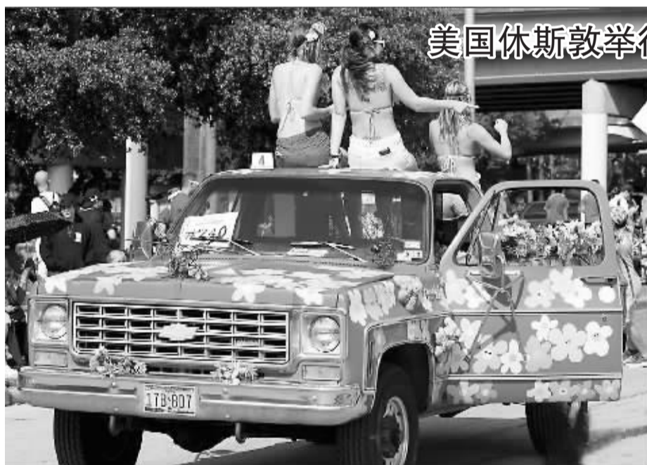
美国休斯敦举行艺术车游行

或许若干年后，我们的后代会嘲笑我们现在制定的一些法律法规，但法规就是法规，我们必须遵守，在遵守的同时寻求改进的方法。