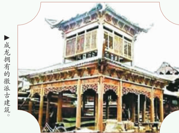
成龙拥有的徽派古建筑。