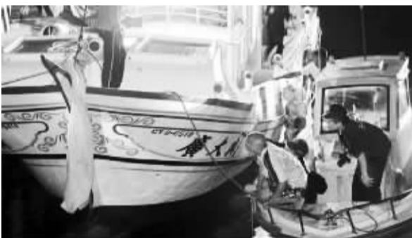
“广大兴 28 号”11 日在台湾海巡部门船只戒护下，由友船拖带返岸。