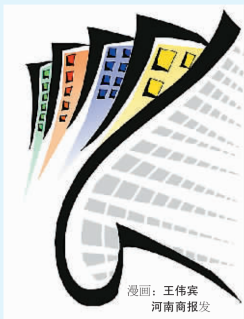
漫画：王伟宾 河南商报