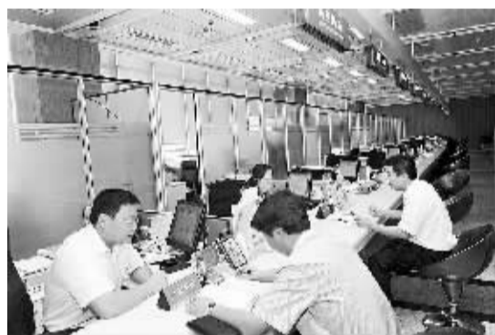
理审批手续。外资企业在青岛商务局办

“我们相信在青岛市政府的关心和支持下，企业一定会得到更好的发展。我们的目标是2020年青岛永旺在山东省内建立150家购物中心、综合百货和生鲜超市店铺永旺。”