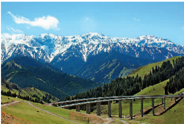
新疆雪山风光旖旎