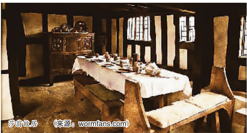
莎翁故居

哲学剧、历史剧、喜剧和悲剧。我肃穆地站在雕像前,看着莎翁身披风衣,前额秃发,浓眉大眼,蓄着好看的美人须。