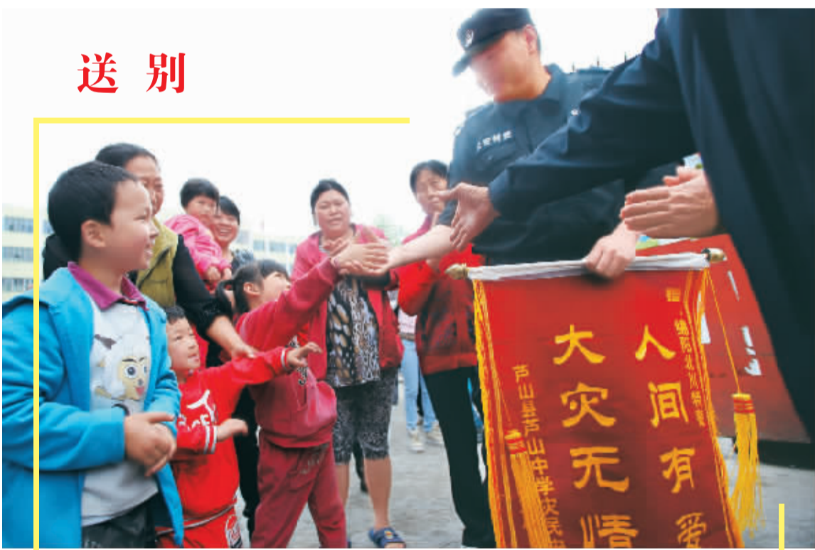
5月6日，四川省绵阳市公安局警员在芦山县设防，已连续17天执行任务的129名绵阳特警离开灾区。图为在老芦山中学受灾群众安置点，孩子们和警察叔叔握手告别。