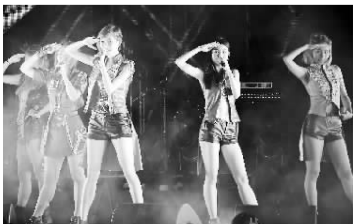
5月4日，“五四青年音乐节”在香港中西区海滨长廊举行。音乐会包括合唱、独唱、舞蹈、乐器独奏等多种表演形式。图为香港组合Super Girls在表演。