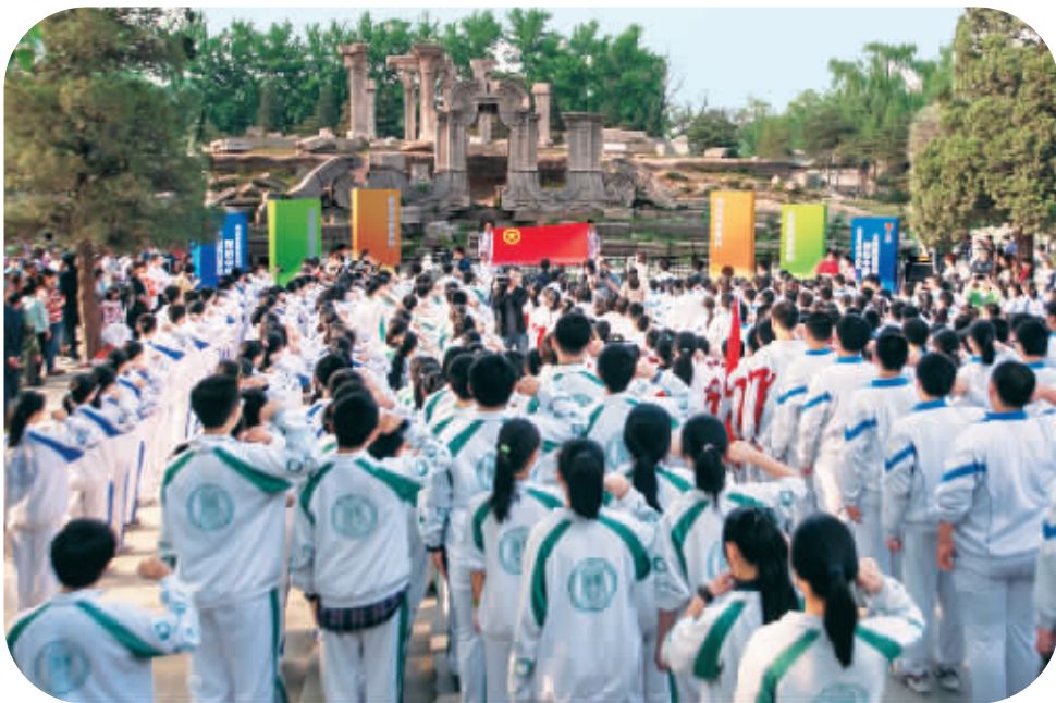
400名北京中学生在圆明园遗址公园的大水法举行入团仪式。

5月3日, 各地青年开展丰富多彩的活动, 以纪念“五四”运动94周年和中国共青团成立91周年。据团中央最新统计, 截至2012年底, 全国共有共青团员8990.6万名、基层团组织359万个。