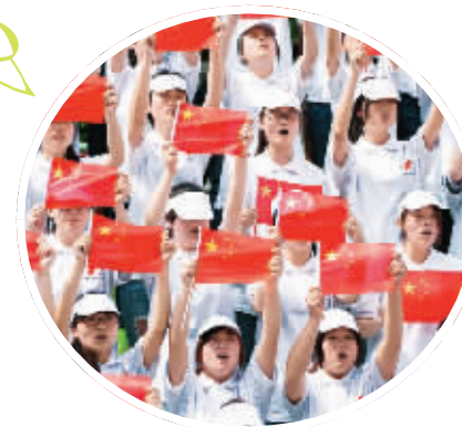
南京高校青年在中山陵音乐台参加“共筑中国梦 践行青春路”主题团日活动。