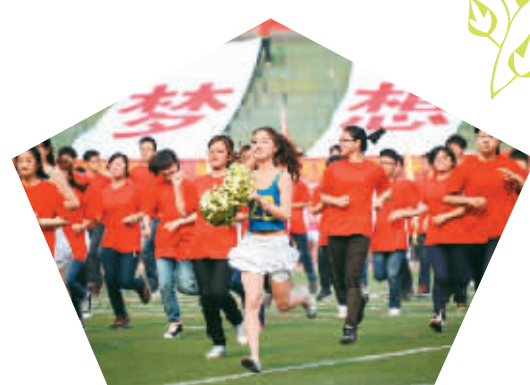
浙江工业大学近千名学生举行迎“五四”广场秀。