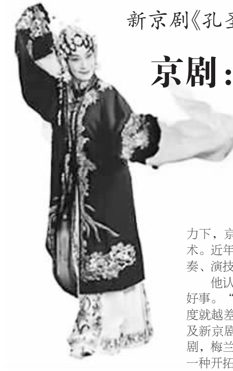
新京剧《孔圣母》(资料图片)

日前，大型历史原创新京剧《孔圣母》登陆央视戏曲频道，让热爱京剧艺术的观众大呼过瘾。作为有着数百年历史的传统剧种，在一代又一代京剧艺术家的努力下，京剧已经成为一个演技严密、行规严格的民族艺术。近年来，京剧表演艺术家吴汝俊对京剧舞台美术、演奏、演技等方面进行了大胆创新。