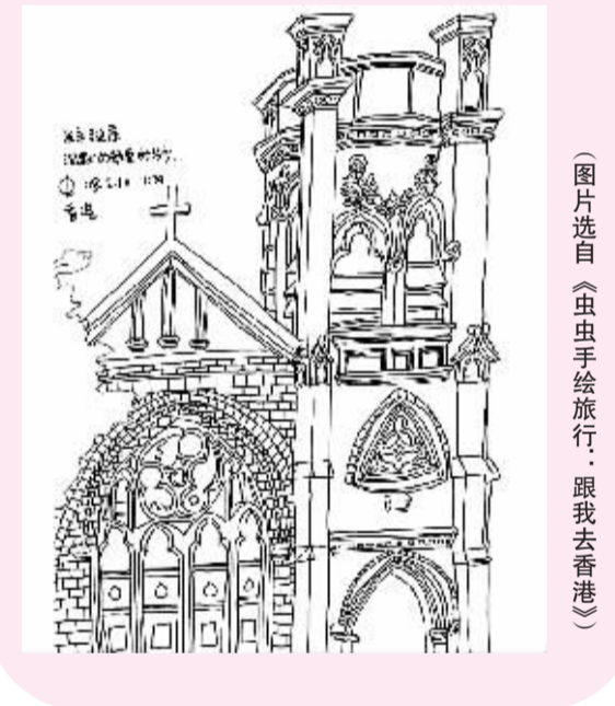
(图片选自《虫虫手绘旅行：跟我去香港》)

手绘旅行行为心灵服务，也为旅行服务。旅途之中，一个人会遇到很多美丽的风景，会发生很多有趣的故事，画者只须定格最精彩的一瞬，用简洁线条表现出来。其实，当“手绘”与“旅行”握手，画得好不好，无所谓，只要亲手画就够了。即便绘画技术一般，只要记录旅途中可爱、可笑、有趣的细节，配上文字解说和内心独白，就可以比照片更动人。