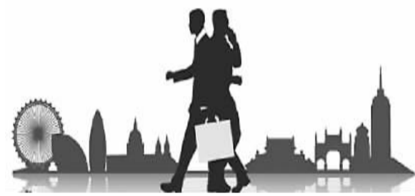
（孙语晨制图）

同是“国际海鸥族”，大家的感受却各不相同。有人认为，当“海鸥”是情非得已，因为事业、亲情很难兼顾；也有人乐在其中。虽然在不同的文化环境中切换并不是一件容易的事，但也是一种难得的生活体验。不少人也愿意享受这样的自由生活，希望能够同时享有两地的信息和资源，通过自己的整合配置，过上理想的生活。也有的人并不喜欢这样的“双城生活”，但是因为工作性质，为了要实现自己的理想和追求，不得不奔波在路上。目前有越来越多的中国人移民海外，面临着两地分居的现实。因为国内的就业机会更多、经济发展态势更好，所以不少人选择将妻儿留在国内，自己在国内打拼，颇为无奈。对于“国际海鸥族”来说，奔波的路上还需仔细思量，尽量在追求理想和维系亲情之间取得平衡。“海鸥族”家庭恐怕要做好心理准备，因为他们往往要在体力、金钱和心灵上付出比一般家庭更大的代价。如果无法改变现实，那就要积极融入两地的生活，这样才能保证生活品质。如果顾此失彼，可能会被漂泊感所困扰，得不偿失。