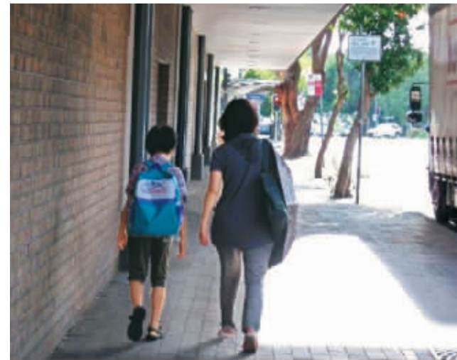
一些母亲更愿意多花些时间和儿女一同成长