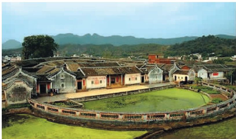
梅州侨乡村围龙屋