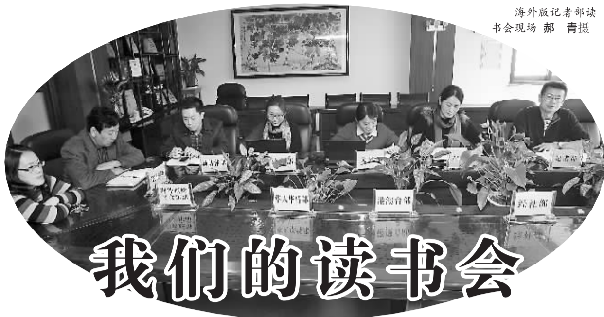
海外版记者部读书会现场