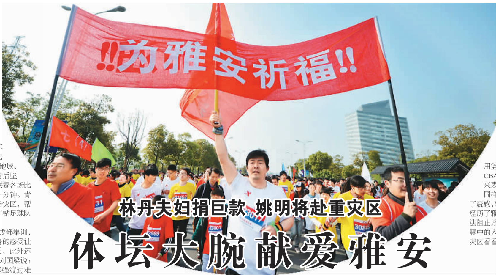
林丹夫妇捐巨款 姚明将赴重灾区

体育没有国界和地域之隔，而爱心亦是如此。“4·20”芦山地震发生后，不仅中国体育人纷纷伸出援助之手，表达哀思之情，众多国际体育人士也关心芦山地震，默哀祈祷。