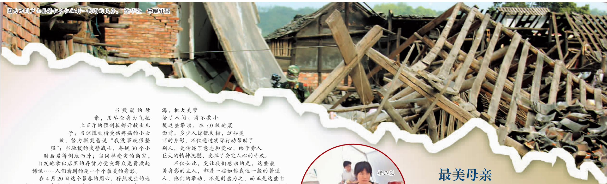
图为四川芦山县蒲江乡仁加村一倒塌的民房。