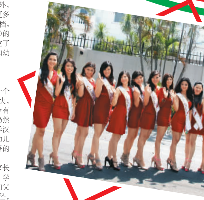
4月15日，“2013年菲律宾中华小姐佳丽中国寻根团”成员在中国驻菲律宾大使馆前合影留念。

据主办方透露，此次为海外华文教师“量身打造”的短期培训班，在课程安排上既有教学技巧方面的理论指导，也有实践性很强的教学观摩。