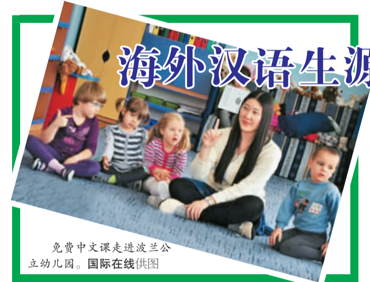
免费中文课走进波兰公立幼儿园。

在海外，幼儿园里开设汉语课似乎已不是什么新鲜的消息；许多国家将汉语列为中小学必修课、选修课的政策亦在陆续出台。