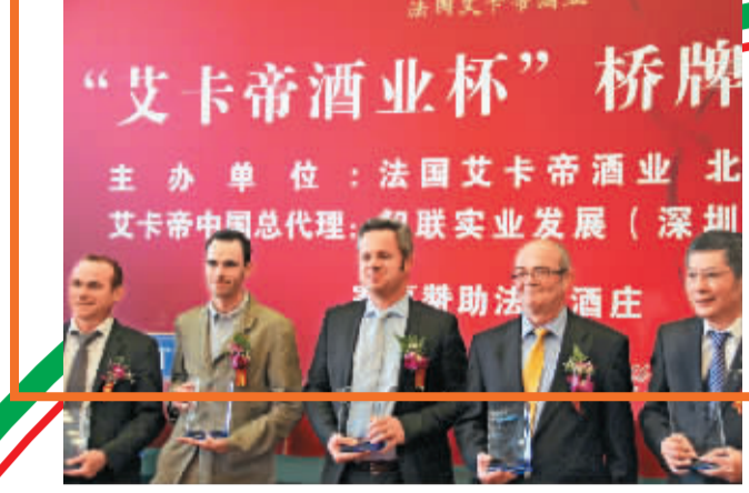
由法国华人举办的“艾卡帝酒业杯”名人桥牌联谊赛，四月十四日在北京人民大会堂落幕。