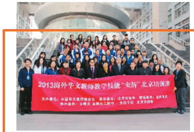
【二〇一三海外华文教师教学技能“金辉”北京培训班】四月十六日在首都师范大学开班。