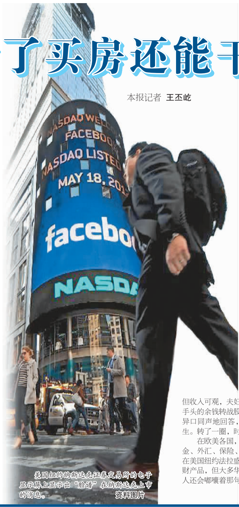
美国纽约纳斯达克证券交易所的电子显示屏上显示出“脸谱”在纳斯达克上市的消息。资料图片

日银总裁黑田东彦在4月4日发表日本央行实施货币宽松政策的具体方案后,日本的金融市场就像被点燃的火箭,出现了飙升行情。经历了20年通缩,特别是2008年“雷曼冲击”以来一直萎靡不振的日本股市终于迎来了希望的曙光。无论这一轮市场行情是暂时的,还是阶段性的,抑或是充满后劲的,反正市场的气氛已经发生了大逆转。和日本的个人投资者一样,许多在日华人在长时间的熊市中被压制已久的股票和基金投资终于有了翻身的机会,也有的人没有把握好时机,美元日元双重受损,还有的人在“雷曼冲击”受损太重,对汇市、股市望而生畏。就在日本央行宣布大胆货币宽松措施后,股市狂升,散户也疯狂。有经历过泡沫经济时代的在日华人散户也忍不住重出江湖入市,直直感觉就像“当年好日子重现”,有从未见过股市好景岁月的年轻人散户更形象地说,现在就连傻瓜入市也能赢钱。(日本《中文导报》报道)