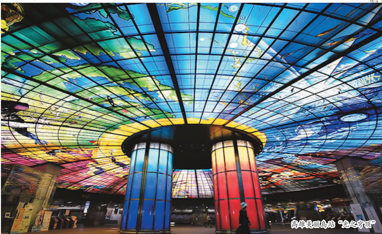
高雄美丽岛站“光之穹顶”

一趟捷运行就是一趟文化之旅吧。搭捷运，陆客穿梭在城市风景之间，感受城市呼吸，人与人，人与城之间，也就有了更深层、更直接对话的可能。