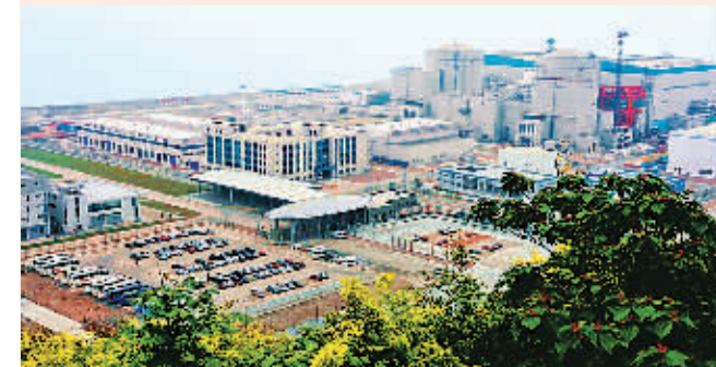
图为宁德核电站主体厂房外景。

本报福建福鼎4月18日电(记者江宝章)4月18日,在经过168小时试运行试验并经福建省电力公司确认合格后,中国广东核电集团福建宁德核电站一期工程1号机组正式投入商业运行。安全、经济、清洁的核电正源源不断地输往福建电网,海峡西岸经济区核电时代正式开启。