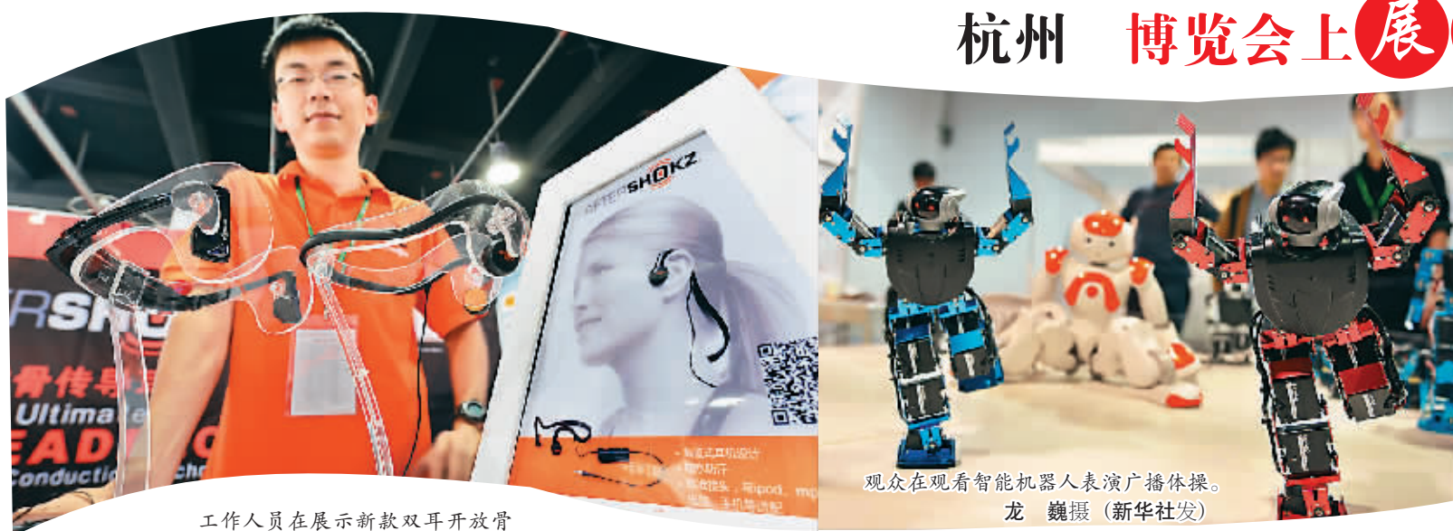
工作人员在展示新款双耳开放骨传导式耳机。