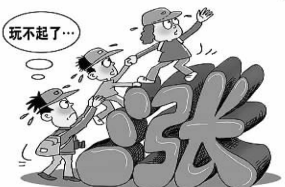
朱慧卿绘

“这绿岛像一只船，在月夜里摇摇……”踏着《绿岛小夜曲》曼妙的旋律，我们来到位于海南岛西南部的霸王岭国家级自然保护区，探寻地球上仅存的23只黑冠长臂猿的踪迹。