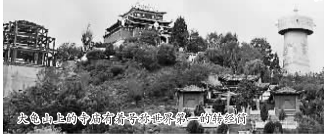
尖色山上的寺庙有着号称世界第一的转经筒