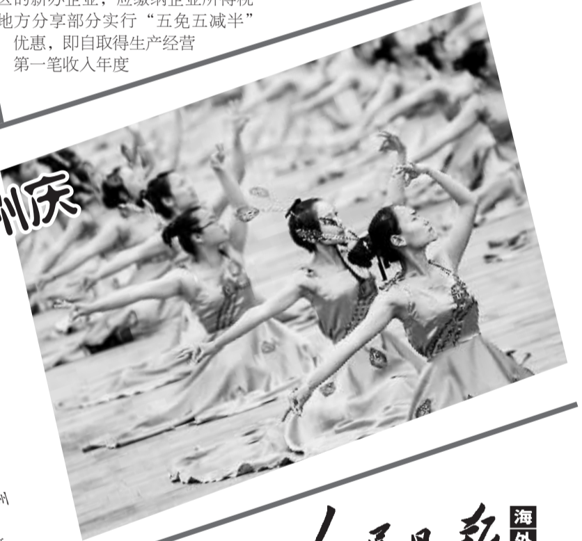
左图:欢聚在州府芒市民族团结广场的人们在泼水狂欢。右图:当地傣族群众在建州60周年庆典上跳孔雀舞。