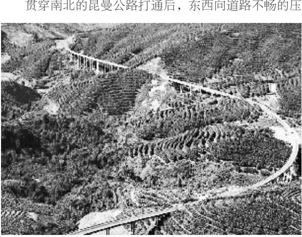
曼昆公路中国境内段小动养—磨憨公路如玉带缠绕在橡胶林间。

此外,各国海关、检疫、安检和文件填报的程序和标准不同,运输时间和物流成本居高不下。