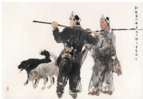
宣如 牧羊图 刘大为作

日前，由新疆克拉玛依市政府策划，国家画院、中国美协学术支持的“五月中国——著名美术家中美巡回展”在北京中国国家画院展览基地马奈草地进行首展。5月3日至7日，展览还将亮相美国纽约联合国总部展厅和新泽西州州立博物馆。此次巡回展汇集了中国美术家协会主席刘大为、中国国家画院院长杨晓