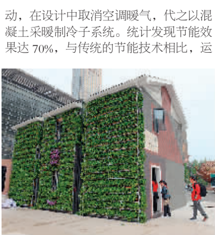
4月10日,参观者在重庆南坪会展中心欣赏“伦敦·重庆低碳之家”。

动,在设计中取消空调暖气,代之以混凝土采暖制冷子系统。统计发现节能效果达70%,与传统的节能技术相比,运营费用仅有其1/3。