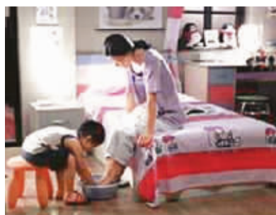
《妈妈洗脚》中的镜头

“他忘记了很多事情,但他从未忘记爱你。”父亲患上了阿尔茨海默病,有时连自己儿子都不认得。儿子带他去饭馆吃饭,父亲居然直接用手抓起盘中剩下的两个饺子,放进了口袋。“爸,你干嘛呀!”儿子不能理解。父亲却吃力地说:“这是留给我儿子的,他最爱吃饺子。”这就是公益广告《关爱老人·打包篇》为我们讲述的感人故事,深藏在父亲心底的爱,感动了无数观众。