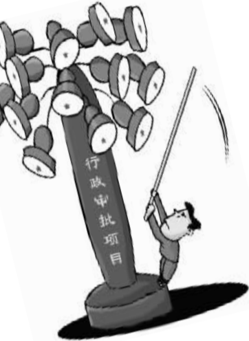
赵乃育作 (新华社发)

“行政审批改变为何推不动,利益问题才是根本。”国家行政学院研究中心丁茂战对本报记者表示,因