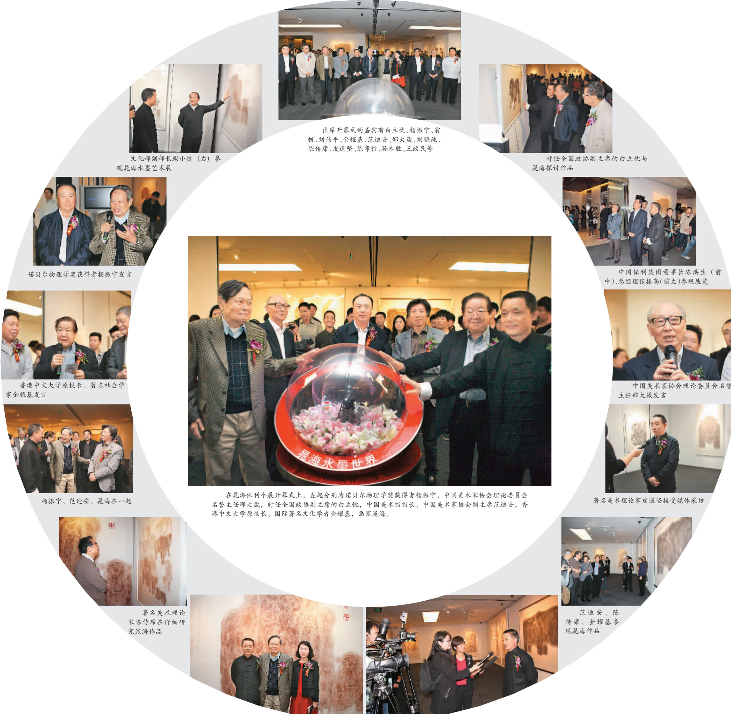
出席开幕式的嘉宾有白立忱、杨振宁、翁帆、刘伟平、金耀基、范迪安、邵大箴、刘骁纯、陈传席、皮道坚、陈孝信、孙本胜、王改民等