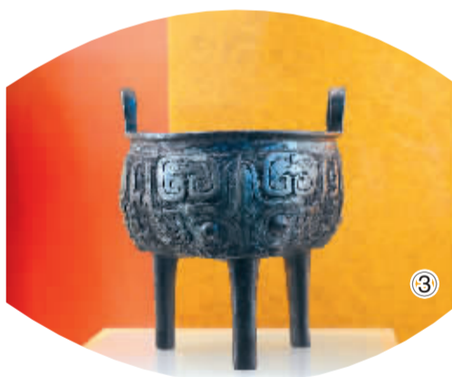
美国著名高校哥伦比亚大学图书馆内，珍藏着一批来自中国古代各个朝代的雕刻、陶器、瓷器和青铜器等文物艺术品精品。这些文物由美国著名艺术品收藏家赛克勒博士捐赠。