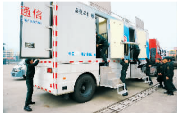
广东省东莞市公路局、电信局等5家企事业单位抽调骨干力量组成的5支民兵装备技术保障分队日前亮相，他们平时为本单位做技术服务，紧急情况下可为东莞的部队提供快修服务。图为他们在抢修通讯设备。