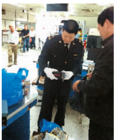
海关关员在查验旅客携带物品

着我们开拓出新思路：首先海关与边防部门的工作区实现对接，确保海关执法更加严格。其次“五纵五横”的监管模式应运而生。“五纵”，即遵循“分类通关”思路设置了居民通道，持多次有效性证件人员携带物品通道，持一次性有效证件人员携带物品通道，无携带物品人员，老幼病残、孕妇以及学生专用通道等五条通道；“五横”是指在通关过程中设置5个功能区，分别是候检区、卡口信息采集区、安全门及X光机检查区、人工查验区和机动查验区。