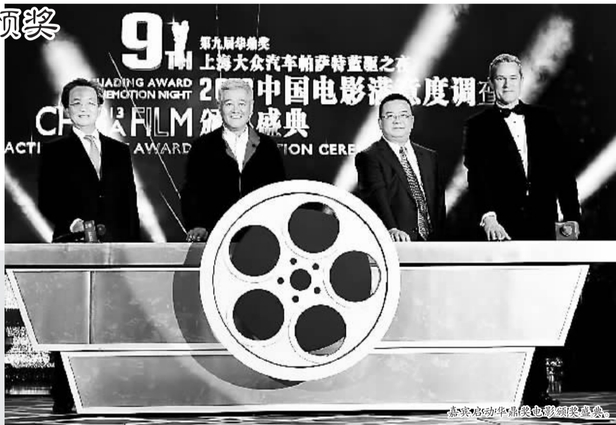
嘉宾启动华鼎奖电影颁奖典礼。