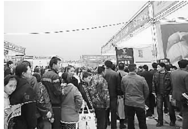
近日，安徽省“国五条”细则出炉。最新数据显示，安徽楼市成交量暂未出现业内之前所预测的太大回落现象。图为安徽阜阳房展会上，排队看房的市民。