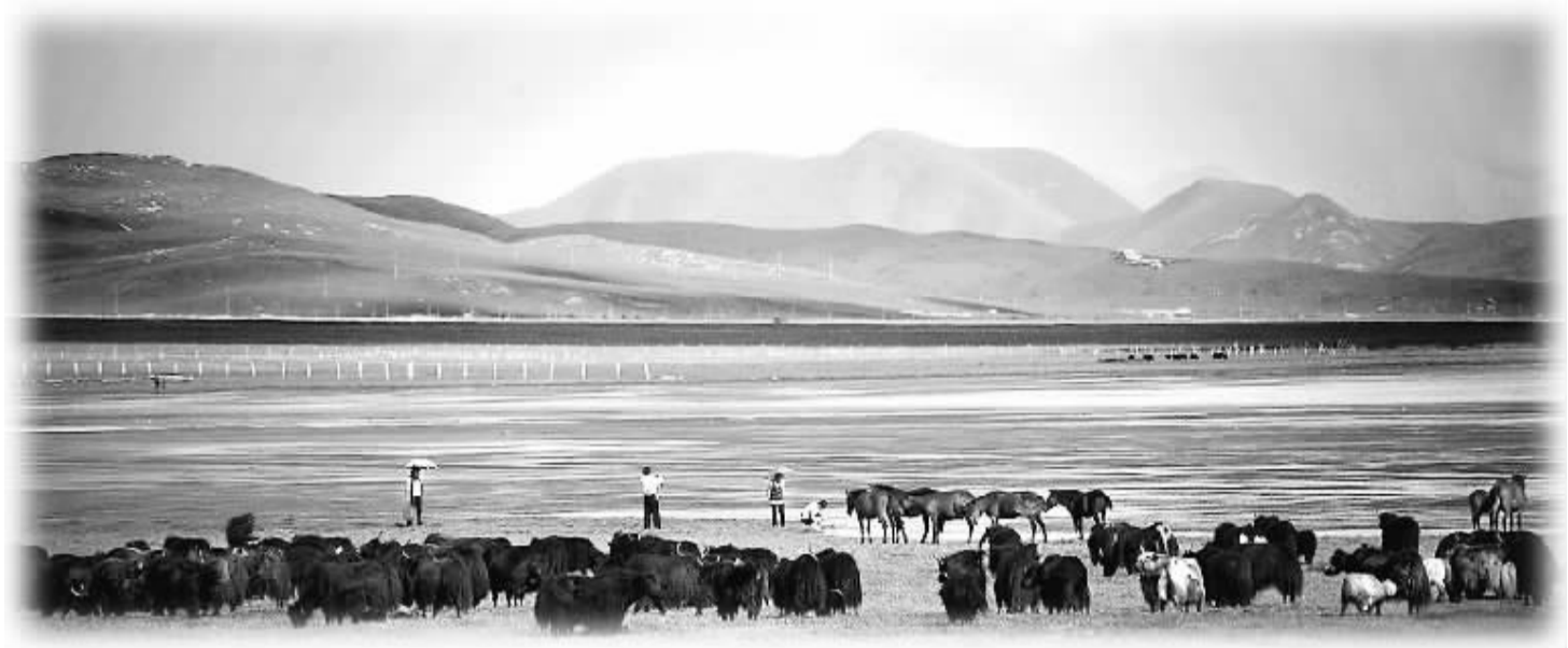
西部风光

由中国旅游研究院区域旅游发展与规划研究所推出的《中国区域旅游发展年度报告 2012—2013》,日前在京正式发布。报告指出,2012 年,我国区域旅游发展实现了国内旅游、入境旅游和出境旅游的稳步快速增长,在区域旅游经济总体格局上,东部地区保持领先优势并持续增长,中部地区实现了稳定快速协调发展,西部地区异军突起,发展空间巨大,形成区域性的“增长极”。同时,海洋旅游、文化旅游、智慧旅游等区域旅游产业不断推进。