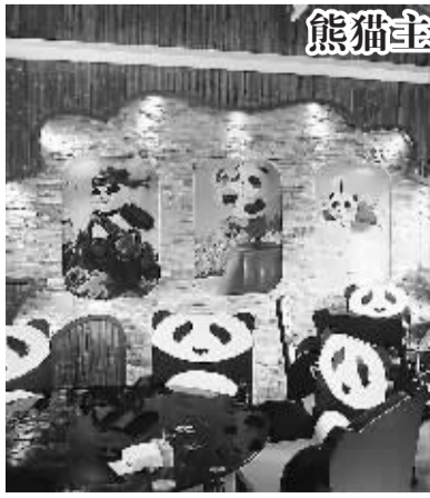
熊猫主题酒店将开业

四川省峨眉山一家以大熊猫文化为主题的庭院式酒店 5 月将开业迎宾。据悉,这是目前全球首家熊猫主题酒店。该酒店的庭院景观、门神、雕塑、过道墙画、房间等皆以熊猫文化为主题,房间里每一样物品也都与熊猫有关。图为由熊猫图案装饰的餐厅。