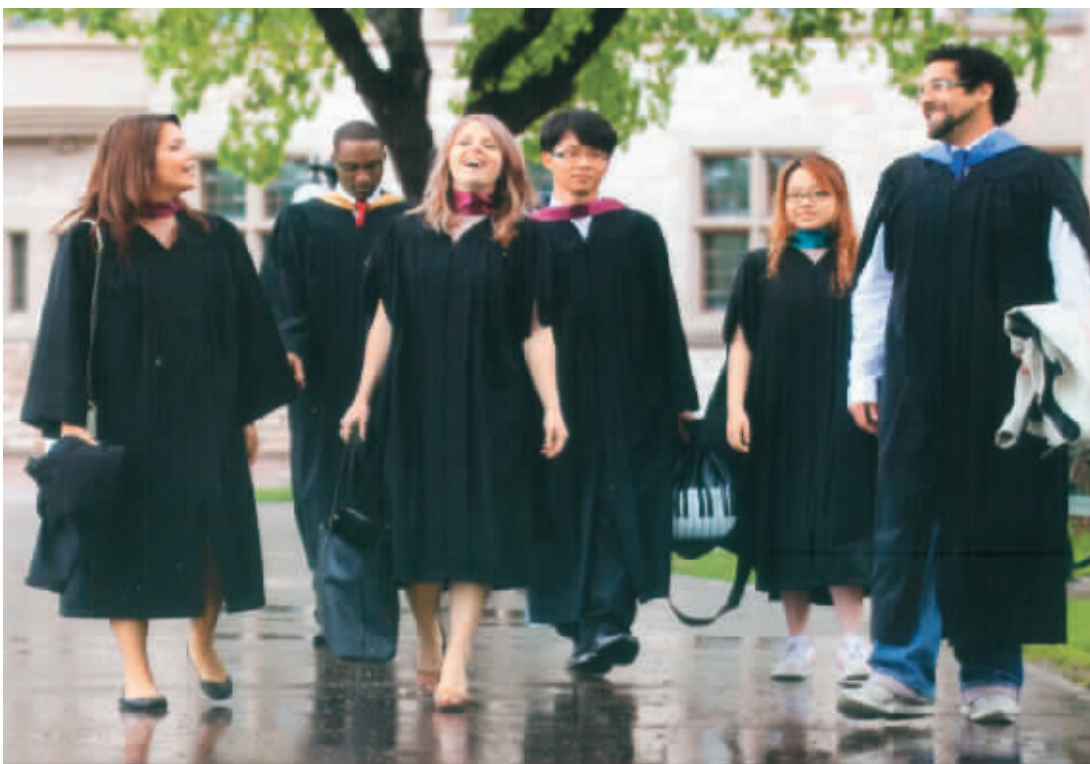
留学加拿大宣传图

白章德还给来中国招生的院校提了建议：善待中国留学生，善待留学人员。“留学生是很好的宣传者，通过他们对学校的介绍，会有更多的学生到他们所就读的院校。”在他看来，口碑相传远比广告要有效得多、可信得多。“我认为善待留学生是非常重要的。”