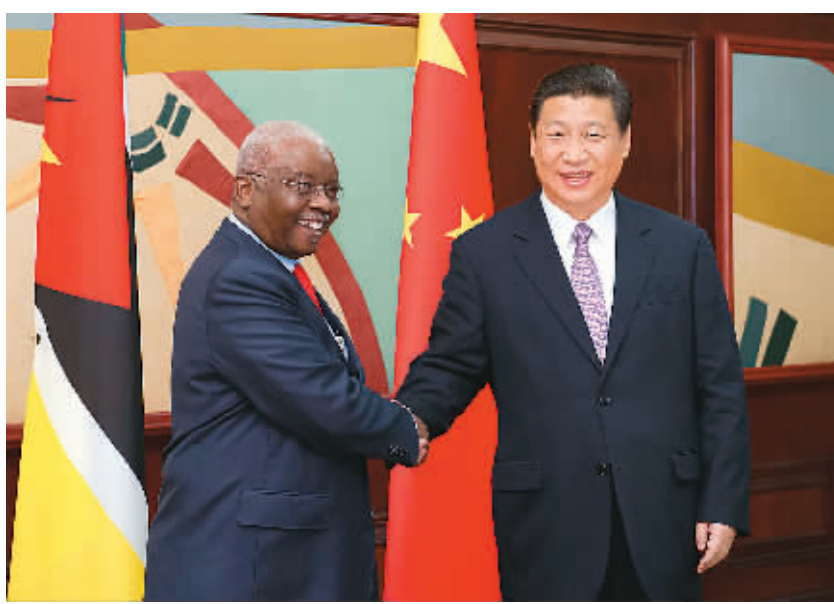
习近平会见莫桑比克总统格布扎。