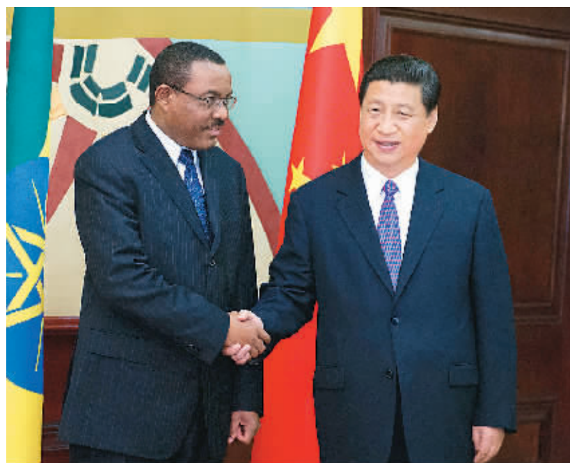
习近平会见埃塞俄比亚总理海尔马里亚姆。