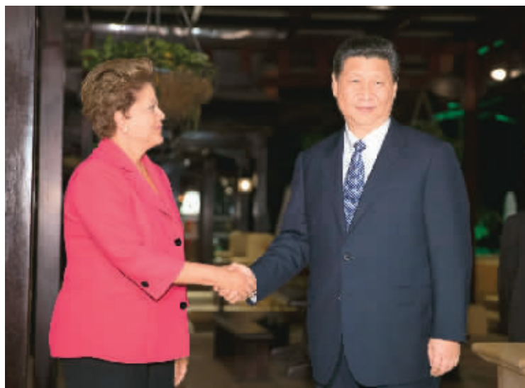
3月27日, 国家主席习近平在南非德班会见巴西总统罗塞夫。