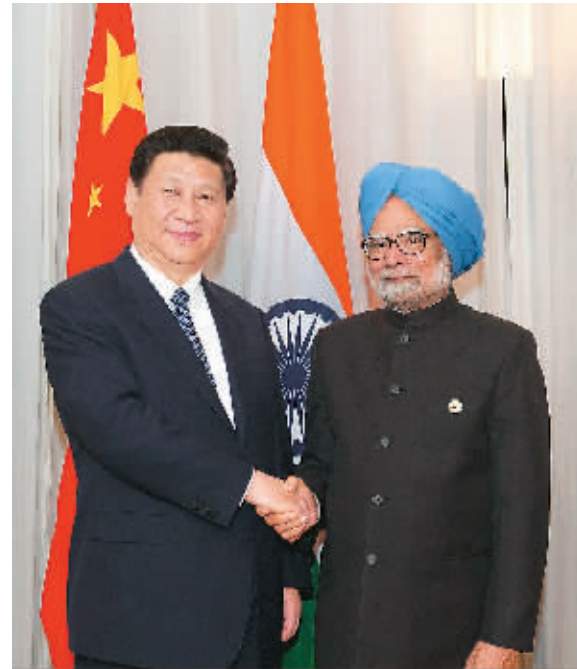
3月27日, 国家主席习近平在南非德班会见印度总理辛格。