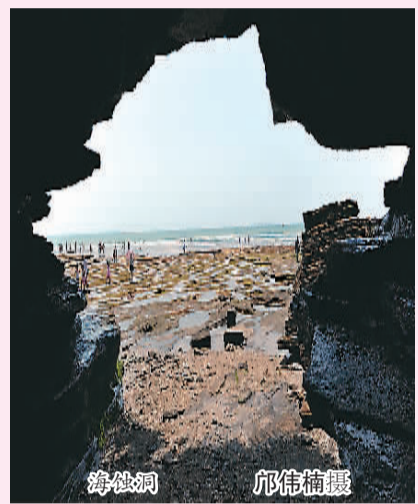
一半海水，一半火焰

从广西北海市抵涠洲岛，须乘船向东南方向穿越21海里海面。记者不久前终于来到这个美丽的岛屿。