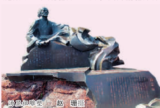
汤显祖雕像

据了解，早在2009年，国家旅游局就把涠洲岛旅游发展列入重点支持的海岛旅游目的地，完成了《北海涠洲岛旅游区发展规划》，提出运用火山、南海珍珠、珊瑚、宗教文化、爱情元素、迁徙候鸟等涠洲岛独特资源，形成主题酒店度假中心、海滩度假中心、休闲农业与乡村度假中心、独岛式的高端度假平台、