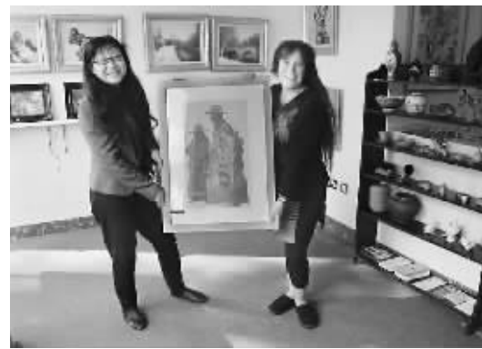
英国牛津市的“舒怡(左一)木板展”开幕。